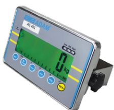
Indicador AE 402