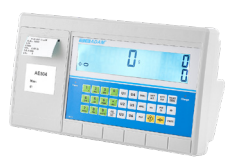
Indicador AE 504