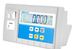
Indicador AE 503