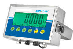
Indicador AE 403