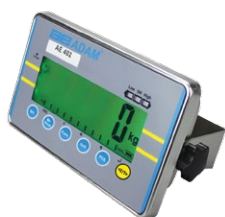
Indicador AE 402