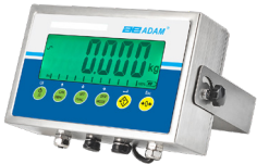
AE 403 Anzeigegeräte